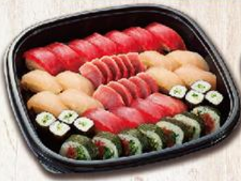
鮪盛合冬 Winter $880

鮪魚握壽司/11、旗魚握壽司/8、鮪魚蔥太卷/7、小皮油生魚片/11、黃瓜細卷/1本