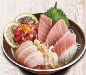
脂井 $288 Toro Don