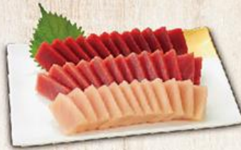
年年有魚 $550 Fish Daily 鮭魚/24、旗魚/12