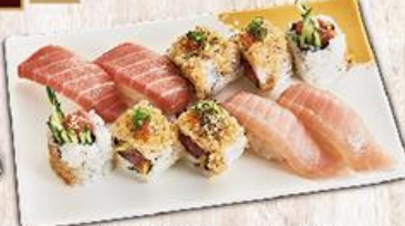
脂太郎 $380 Chutoro Combo