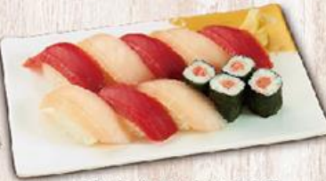
鮪盛合彩衣 $165 Tuna Marlin Combo