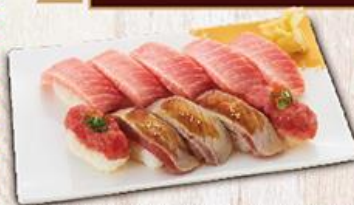
鮪盛合細雪 $600 $650 Otoro Combo