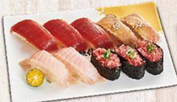
鮪盛合舞鶴 $230 Agami Combo