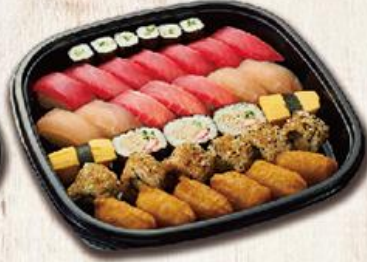
鮪盛合春 Spring $600

赤身握壽司/10、旗魚握壽司/4、米果卷/6、黃瓜細卷/1本、鮪魚沙拉太卷/3、玉子燒/2、豆皮/6