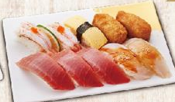
米克斯壽司 $188 Combo Mixed