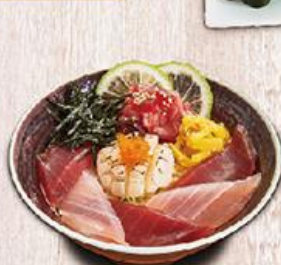
鮪魚丼飯 $188 5pcs Tuna Sliced Don