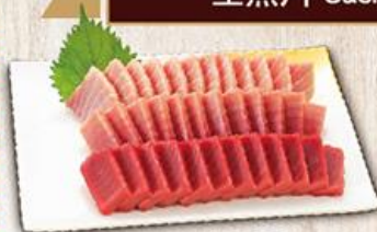
幸福168 $1688 Wealthy 168 大脂/12、小脂/12、赤身/12