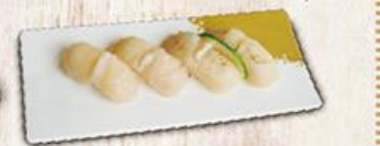
干貝握壽司 $200 Hokkaido Sea Scallop Sushi