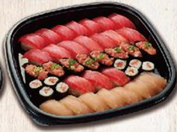
鮪盛合秋 Autumn $730

鮪魚握壽司/11、旗魚握壽司/8、鮪魚蔥太卷/7、小皮油生魚片/11、黃瓜細卷/1本