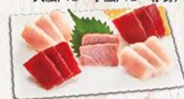
招牌三合一 $460 All In-One 中脂/2、小皮/6、赤身/6