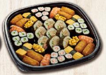
鮪盛合夏 Summer $600

赤身握壽司/10、旗魚握壽司/4、米果卷/6、黃瓜細卷/1本、鮪魚沙拉太卷/3、玉子燒/2、豆皮/6