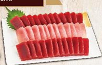
豪華生魚片 $700 Deluxe 小皮/12、赤身/24