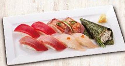
握壽司套餐 Sushi Combo B