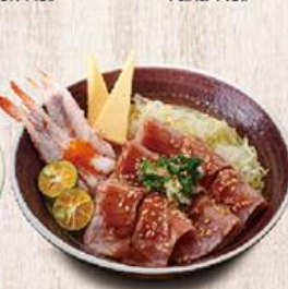
半熟鮪井 $200 Tataki Tuna Don