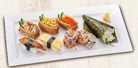
綜合壽司套餐 Sushi Combo A