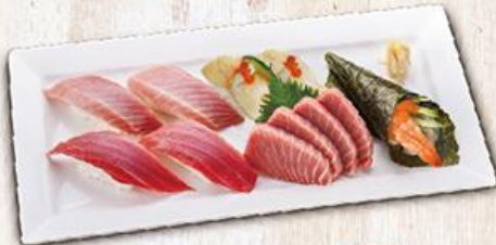
鮪盛合脂套餐 Sushi Combo C

* 所有套餐皆附味噌湯 All combos come with miso soup.