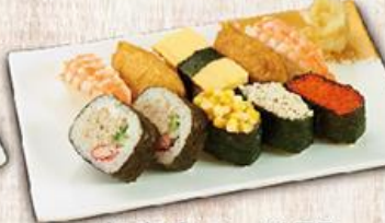
松島壽司 $175 Cooked Sushi Combo